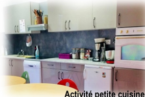
Activité petite cuisine