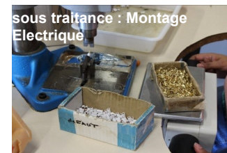
sous traitance : Montage Electrique