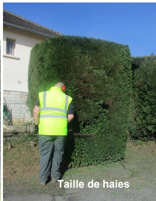
Taille de haies