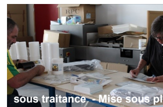
sous traitance - Mise sous pli

Travaux à façon pour les entreprises et les collectivités (petits montages électriques ou mécaniques, étiquetage, mise sous pli, tri, conditionnement, confection de coffrets cadeaux) - enlèvement et livraison