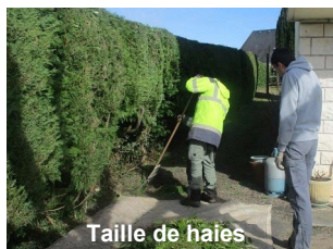
Taille de haies

Entretien de parcs et jardins. Tonte, taille de haies et d'arbustes, débroussaillage, ramassage de feuilles, création de massif .